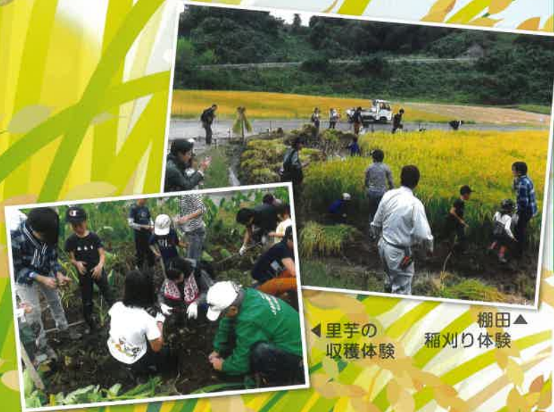
▲棚田 稲刈り体験 ←里芋の 収穫体験

期 日 令和8年10月10日(土) 9時30分～11時30分頃まで (雨天の場合は10月11日(日)) 場 所 高崎市吉井町上奥平520(かくや姫の里 棚田) 参加費 親子で2,000円(里芋1kgお土産つき) ◆農作業のできる服装にてご参加ください。 ◆収穫後お米1kg進呈いたします。