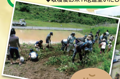
▲じゃがいもの収穫体験